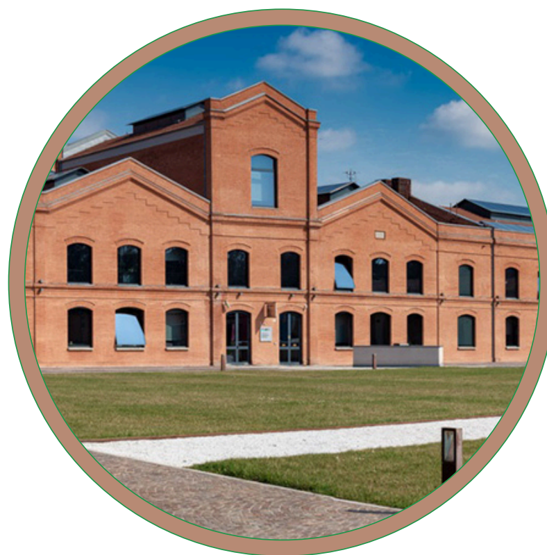
Evento Fuori Salone IAIA25

26-27 marzo 2025, Montichiari (BS) Centro Fiera