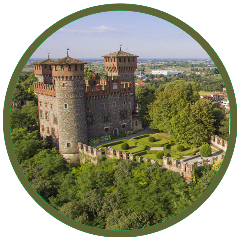
World Wide Hackaton 2025