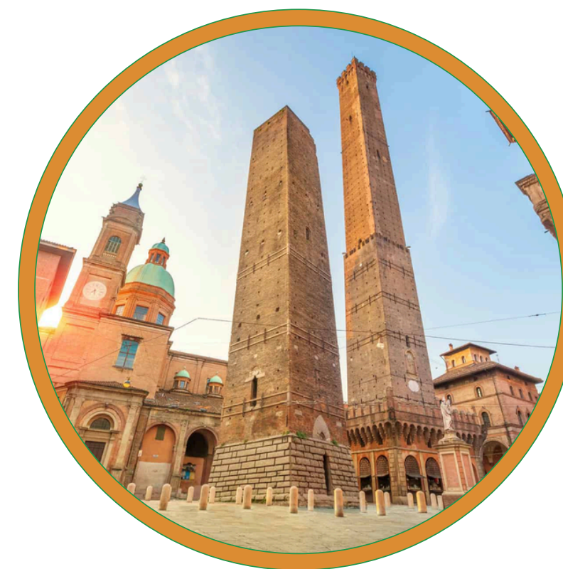
Impact Assessment in the Age of Artificial Intelligence

Aprile 2025, Bologna(BO) HQ Herambiente Spa